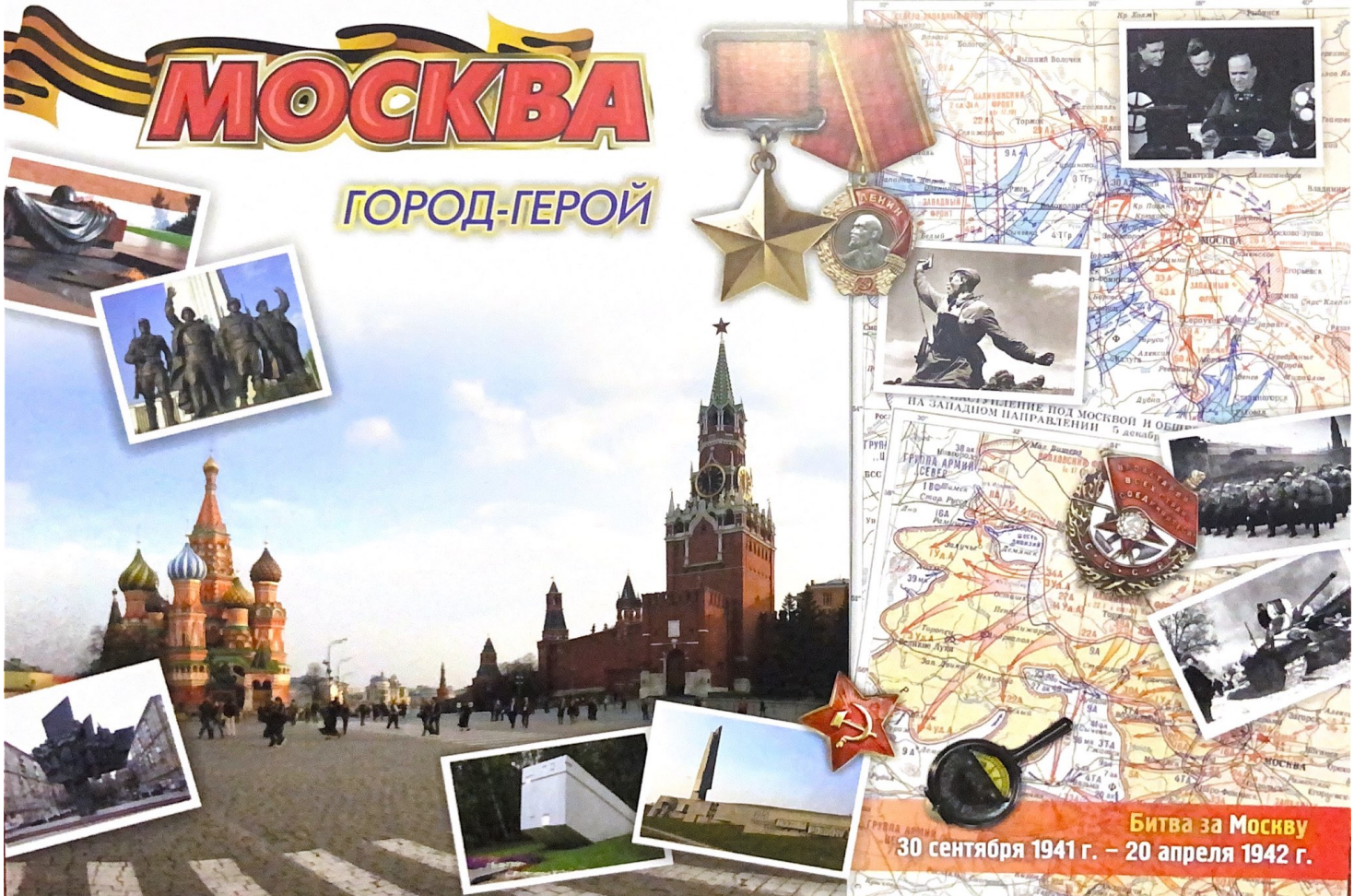
ГЕРОИЧЕСКАЯ ОБОРОНА МОСКВЫ 30 сентября - 5 декабря 1941 г.